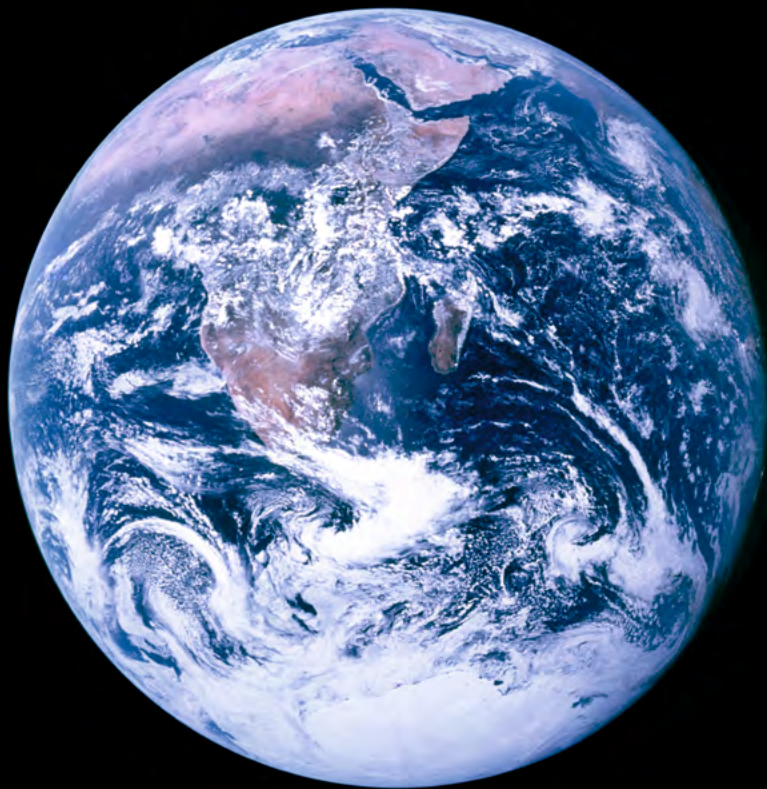
Blue Marble Apollo 17 7. Dezember 1972